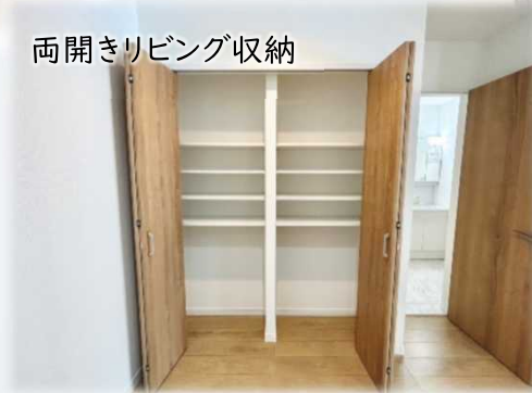
両開きリビング収納