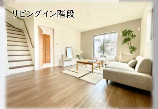
リビングイン階段