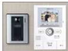
カラーモニター付 インターホン