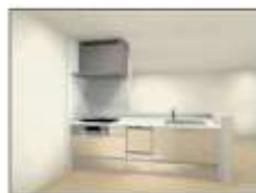
浄水器 & 食洗機付 システムキッチン