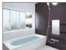
浴室暖房乾燥付 システムバス