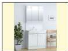
シャワー水栓付き 洗面化粧台