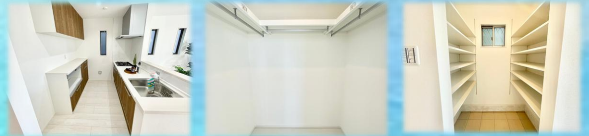
↑イメージ画像です♪ (左からカップボード,WIC,SIC)