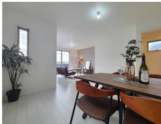
《リビングダイニング》