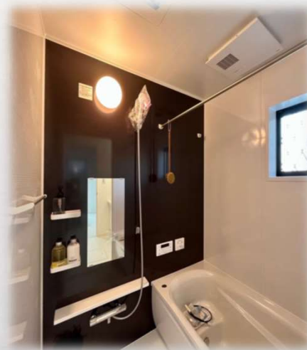
〈イメージ写真：浴室〉