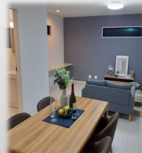
〈イメージ写真：リビング〉