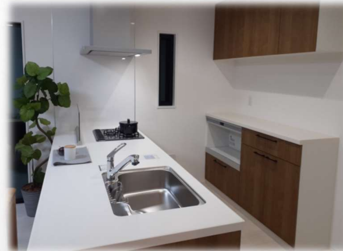
〈イメージ写真：キッチン〉